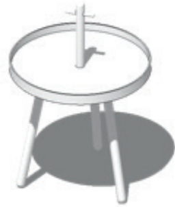
Fertig zusammengebauter Beistelltisch